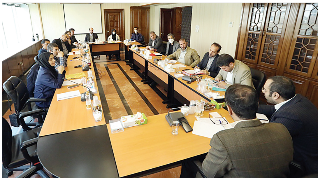
نخست‌مدیران برنامه بودجه و وزارت فرهنگ و ارشاد اسلامی در مرکز پژوهش‌های مجلس