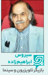
سیروس ایراهیم‌زاده بازیگر تلویزیون و سینما