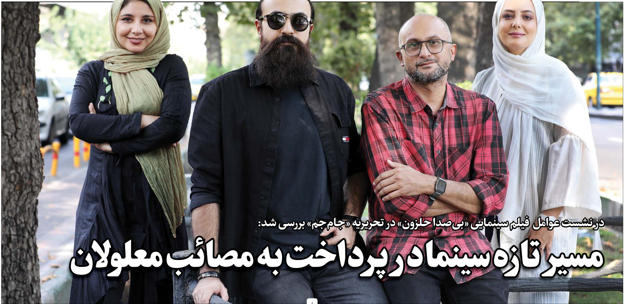
دانشجویان فیلم سینمایی «بی صدا حلزون» در تحریریه «جام جم» بررسی شد: