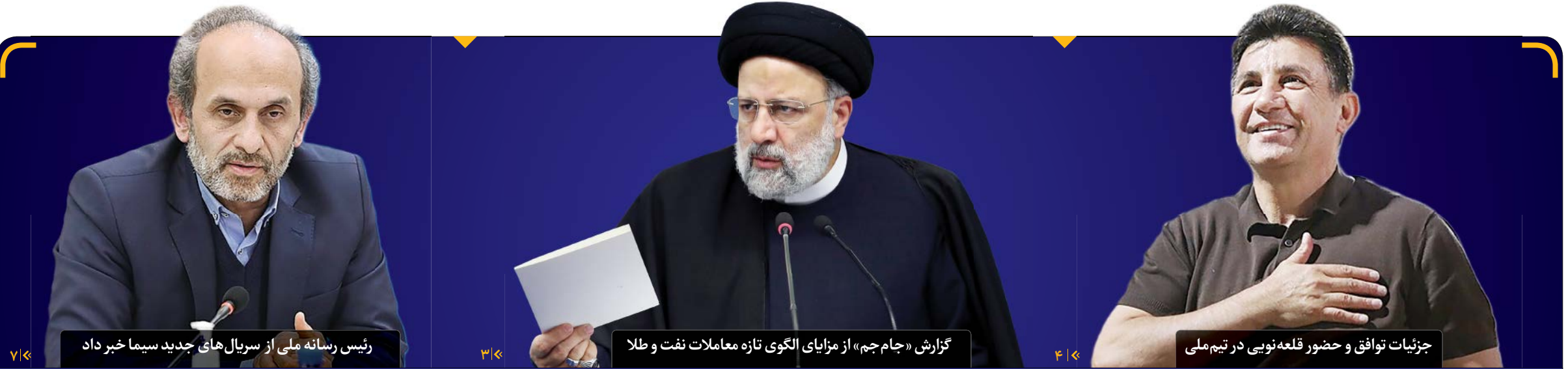
رئیس رسانه ملی از سریال‌های جدید سیما خبر داد